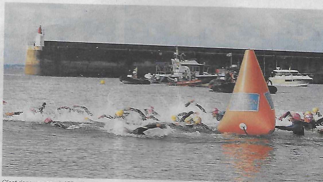
C'est dans une eau à 18° qu'ont évolué les nageurs qui participaient à cette 5 e édition.