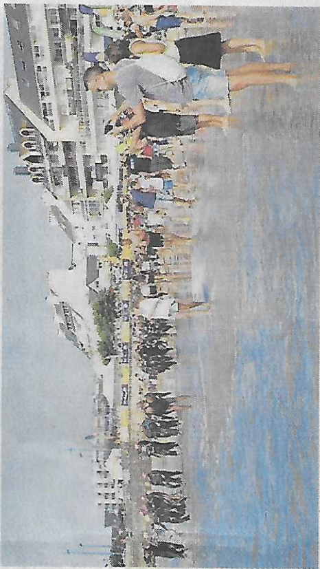
Famille, amis, public étaient au rendez-vous sur la plage, hier matin.