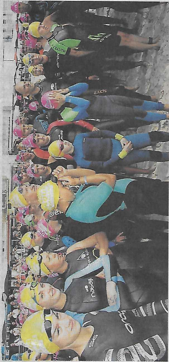
Avant le départ, l'heure est au briefing des nageurs.