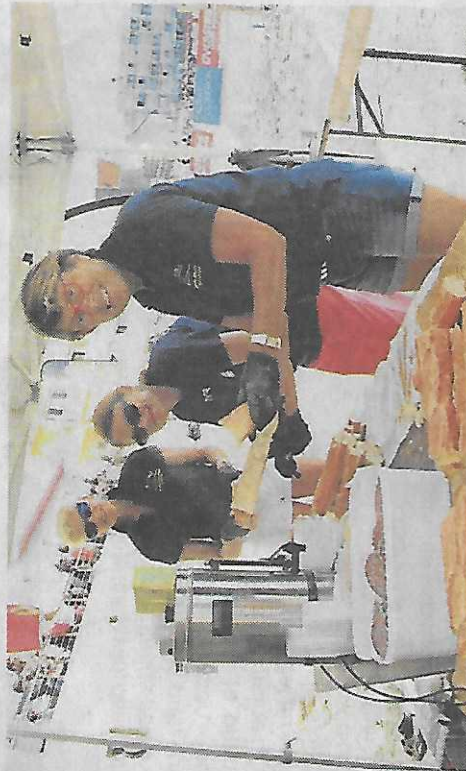
Les Défis quiberonnais, c'est aussi des sandwiches à préparer pour 135 bénévoles.