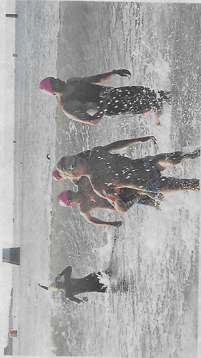
Sportifs des grands clubs français et jeunes se sont retrouvés dans la première épreuve de 500 m.

À 11 h, 172 nageurs se sont lancés dans le Défi des Feux pour 1 500 m, puis, à 14 h, le Défi du Carl Bech a réuni 350 participants. Sportifs amateurs et élite sont bien au rendez-vous de cette 5 e édition des Défis quiberonnais, placés sous le signe de la bonne humeur. L'épreuve, entrée dans le top 10 français, aux côtés de Nice, Bordeaux, Marseille, Paris, est désormais devenue incontournable dans le calendrier des épreuves de natation en eau libre. Près de 850 nageurs auront en effet pris le départ ce week-end et 135 bénévoles se seront