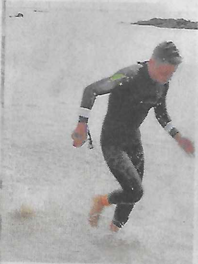
Les participants ont fini par un sprint acharné.

Quiberon — Ce week-end, Quiberon a mis l'eau libre à l'honneur. Avec ses 850 nageuses et nageurs, les 5 e Défis quiberonnais se sont terminés en beauté, dimanche.